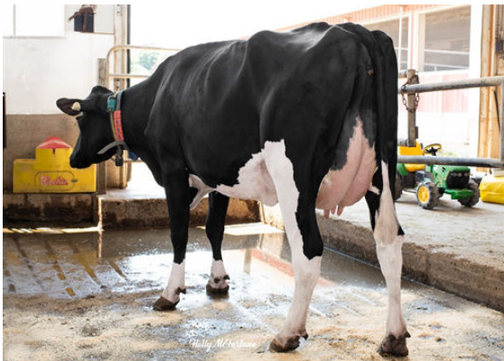
PROGENESIS CHARLEY TULIP THIRD DAM